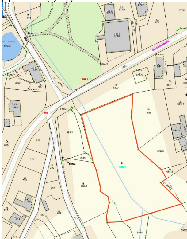
p.p.č. 685/1 (výkup):