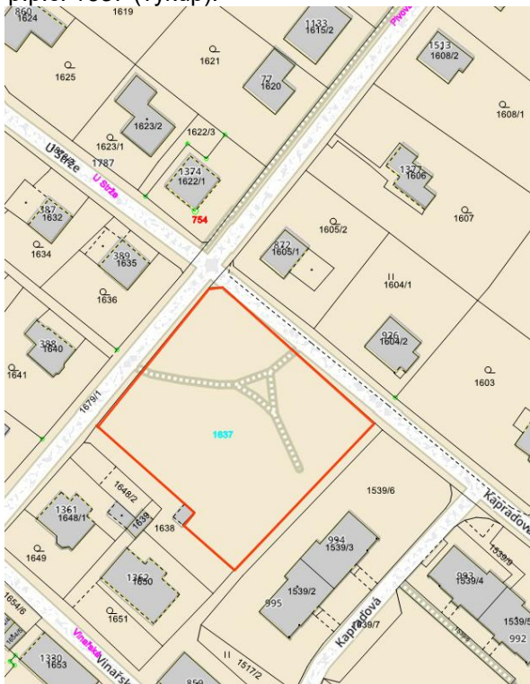
p.p.č. 1637 (výkup):