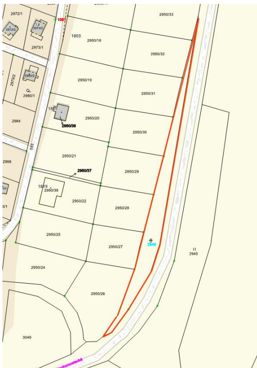
p.p.č. 2949 (prodej):