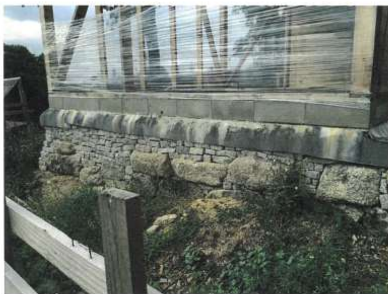
foto 2: dostavba stávajících základů, západní strana (srpen 2016)