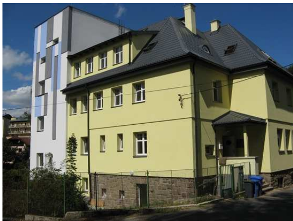
Vlčí vrch 323, Liberec 15

Kontrolu za účasti ředitelky organizace Bc. Vladimíry Řáhové provedly: