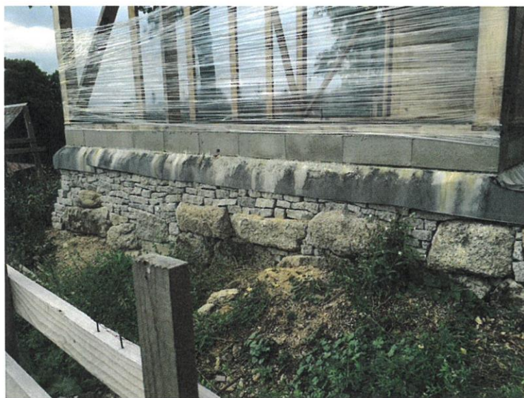
foto 2: dostavba stávajících základů, západní strana (srpen 2016)